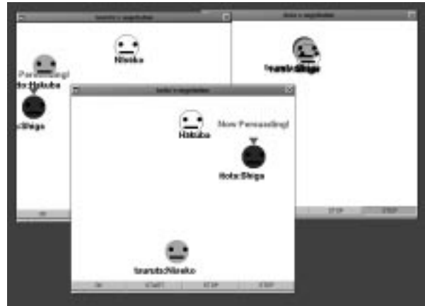
図 2: 多重交渉の視覚化

えば、「STOP」ボタンで交渉を一時停止することが可能であり、「START」ボタンで再開できる「STEP」ボタンを用いることによってステップバイステップで交渉を進めることができる。